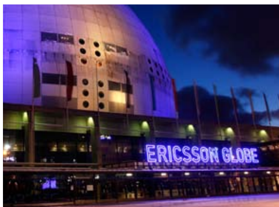
Avtalet med Ericsson trädde ikraft i februari. Nu heter världens största sfäriska byggnad Ericsson Globe.