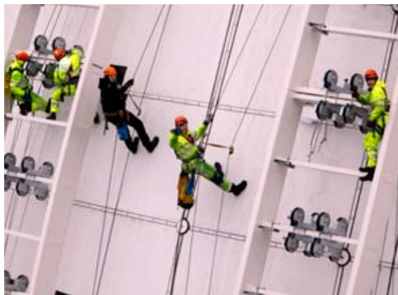
Med hjälp av Sveriges bästa klättrare monterades rälsen för SkyView på utsidan av Ericsson Globe.