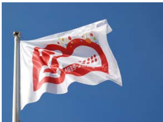
I februari fyllde Ericsson Globe 20 år. Sedan invigningen 1989 har drygt 20 miljoner besökt arenan.