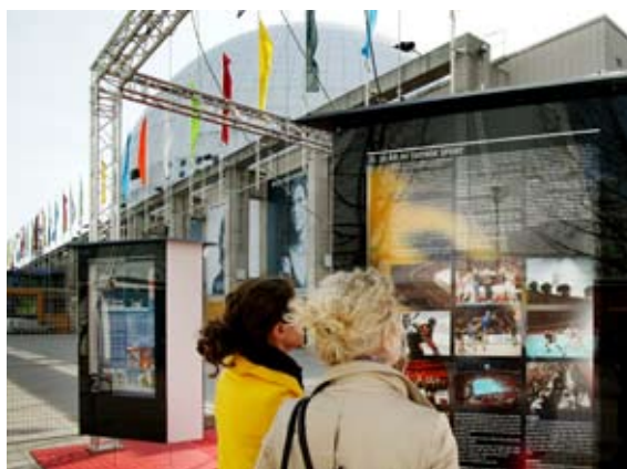
Globe Expo invigdes under jubileumshelgen i april. Utställningen tar besökaren 20 år tillbaka i tiden samt presenterar framtidsvisionerna för hela Globenområdet.