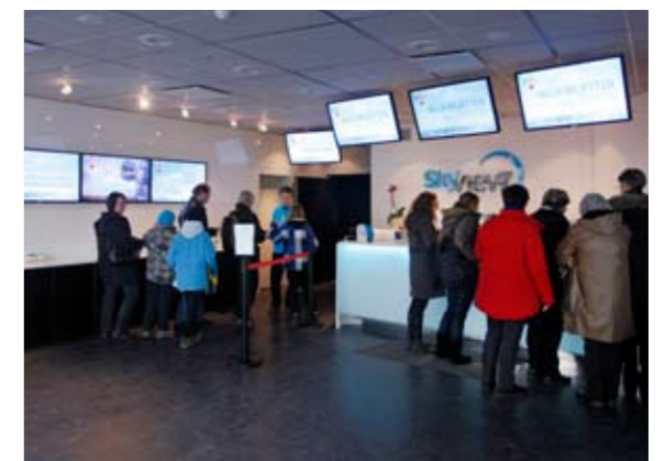
Stockholm Globe Arenas servicecenter öppnade i anslutning till SkyView.