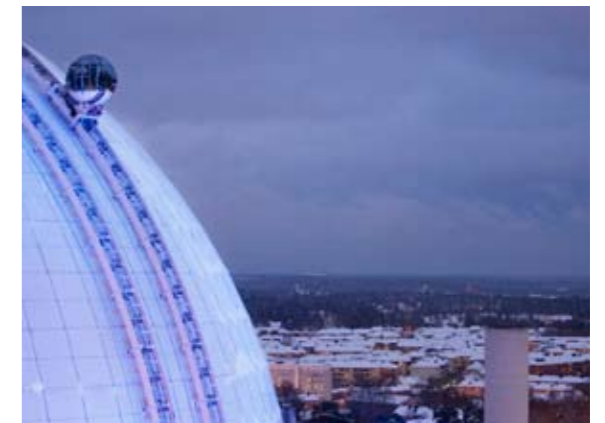
SkyView hade premiär den 5 februari och blev under första året en välbesökt succé med hela 160.000 resenärer.